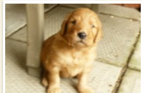
Quelques jours après la naissance

Tous les parents de la classe de 6e année ont accepté la présence du chien dans la classe. Un questionnaire sur les allergies et la crainte liée aux animaux a été distribué à tous les employés de l'école ainsi qu'aux parents de cette classe. Une affiche à l'entrée de notre école et à l'entrée de la classe, indique qu'un chien est présent dans l'école. Un horaire sera affiché pour s'assurer de faire connaître à tous la présence de l'animal