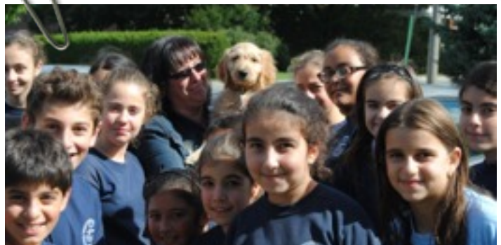
Première visite surprise de Boom à l'extérieur de l'école

La présence d'un animal en classe peut aussi être l'occasion pour certains élèves de développer leur estime de soi, par les soins prodigués à l'animal et son amour inconditionnel.